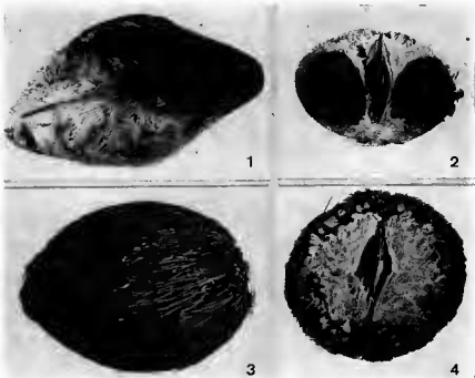
Pl. 1. — Ochrosia elliptica : 1, fruit; 2, coupe du même : on voit nettement les cavités latérales de l'endocarpe. — Calpicarpum thiollierei : 3, fruit, 4, le même en coupe : on distingue nettement les fibres du mésocarpe et l'absence de cavités latérales dans l'endocarpe.

Les photographies jointes illustrent clairement ces différences (Pl. 1 et 2).